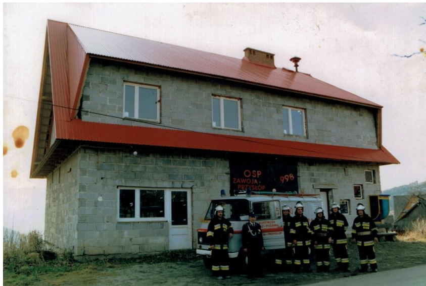
Remiza strażacka została oddana do użytku w 2011 r. Wtedy też otrzymała sztandar.