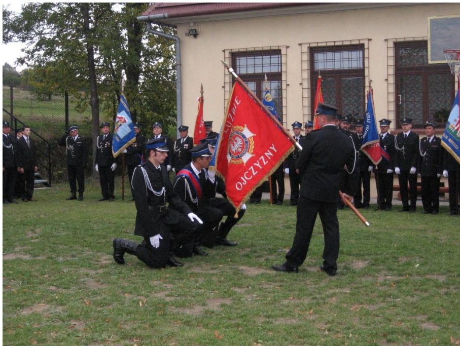
Przy tutejszej OSP od wielu lat działa Młodzieżowa Drużyna Pożarnicza, której członkowie odnoszą sukcesy w turniejach wiedzy pożarniczej oraz w zawodach strażackich.